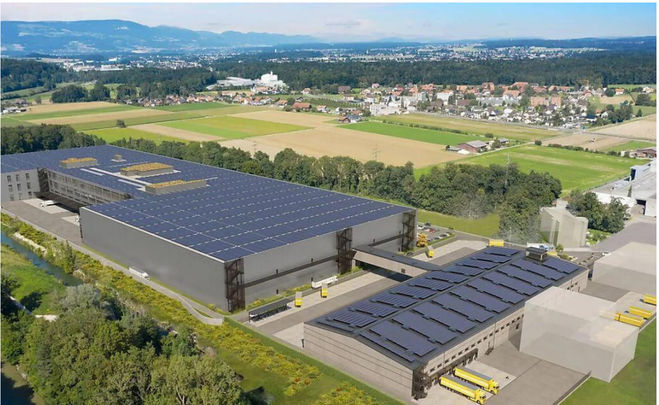
Abb. 1: Fotomontage des «New Operations Center» (NOC) (BZ, siehe [1] )

Die Migros-Tochterfirma Digitec Galaxus AG reichte am 9. Dezember 2020 ein Baugesuch ein und im Oktober 2021 folgte das Baugesuch der Post. Mit dem Bau des gemeinsamen «New Operations Center» sollte nach ursprünglicher Zeitplanung bereits 2021 begonnen werden (siehe [12] ).